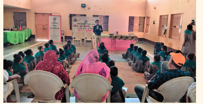
પલીયડ ગામ તા. કલોલ, જી. ગાંધીનગર