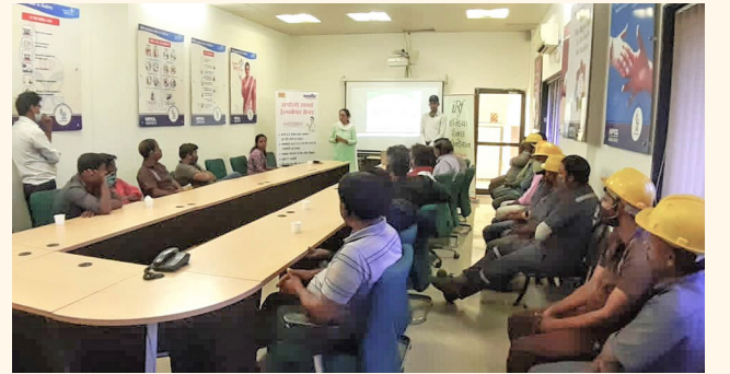
ઈન્ડિયા પેટ્રોલિયમ કોર્પોરેશન લિમિટેડ, સુરત