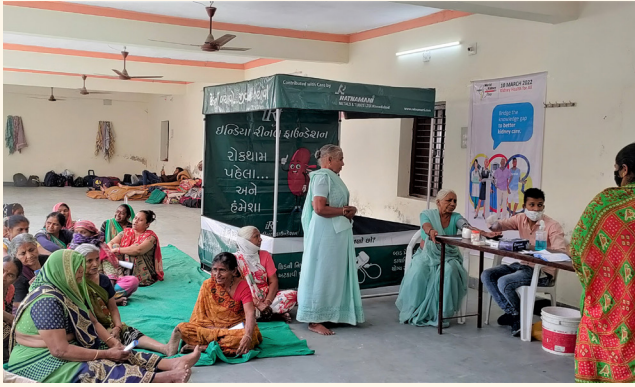
દેદીયાસણ ગામ, તા.જી. મહેસાણા