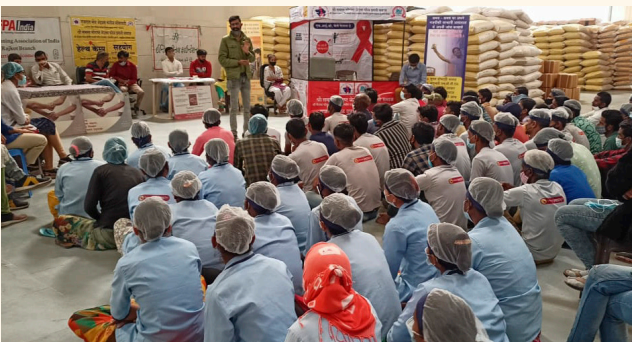
જયંત સ્નેક્સ એન્ડ બેવેરેજ્સ પ્રા. લિ, રાજકોટ