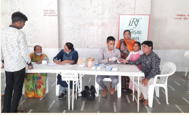
લક્ષ્મીનગર, નાના વરાછા, સુરત