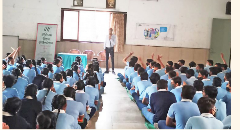
આઈ.ટી.આઈ રાજકોટના વિદ્યાર્થીઓ માટે કિડની જાગૃતિ કાર્યક્રમ

વિશ્વ કિડની દિવસ નિમિત્તે સંસ્થા દ્વારા આયોજિત વિવિધ કાર્યક્રમ અને પ્રવૃત્તિઓની નોંધ આ દિવસ ઉજવવાની પહેલ કરનાર ઇન્ટરનેશનલ સોસાયટી ઓફ નેફ્રોલોજી (ISN) અને ઇન્ટરનેશનલ ફેડરેશન ઓફ કિડની ફાઉન્ડેશન (IFKF) દ્વારા લેવાઈ હતી અને વિશ્વ કિડની દિવસની વેબસાઈટ www.worldkidneyday.org પર તેનો ઉદ્દેશ કરીને સંસ્થાની કામગીરીને બિરદાવવામાં આવી હતી.