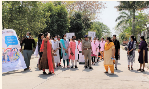
મહિલા પોલીસ સ્ટેશન અને આઈ.ટી.આઈ. વડનગર ના સહયોગથી વડનગર શહેરમા કિડની જાગૃતિ રેલી.