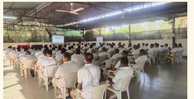
પોલીસ હેડક્વાર્ટર, વડોદરા