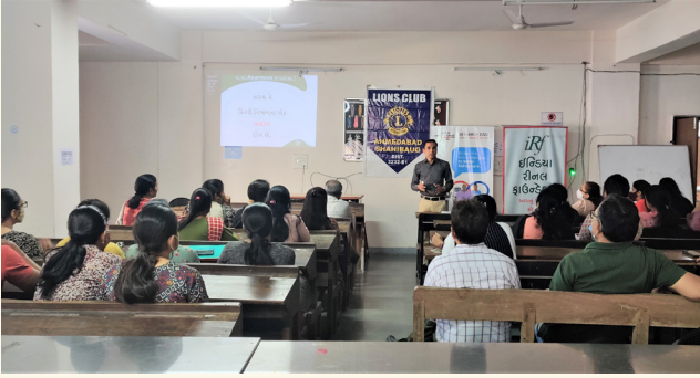
સરકારી મહિલા પોલિટેકનિક કોલેજ, અમદાવાદ