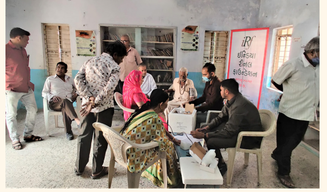
લુવાલડી ગામ, તા. દાસકોઈ, જી. અમદાવાદ