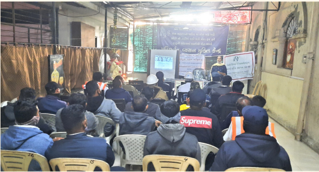
પરિવર્તન નશામુક્તિ કેન્દ્ર, સુરત