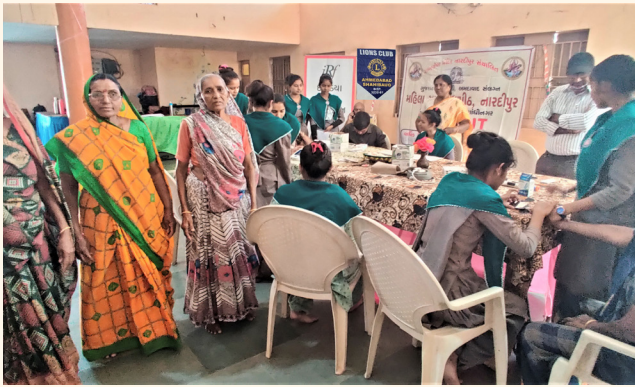
પલીચડ ગામ, તા. કલોલ, જી. ગાંધીનગર