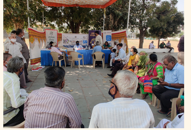
શ્રી નીલકંઠ મહાદેવ મંદિર રાણીપ, અમદાવાદ ખાતે નિદાન કેમ્પ

આ ઉપરાંત આ દિવસે રાણીપ વિસ્તારના નાગરિકો માટે શ્રી નીલકંઠ મહાદેવ મંદિર, બલોલનગર, રાણીપ, અમદાવાદ ખાતે વિનામૂલ્યે બીપી, ડાયાબિટીસ અને કિડની (સીરમ ક્રિએટીનાઈન) માટે તબીબી પરીક્ષણ પણ કરવામા આવ્યુ હતુ જેનો ૨૫૦ નાગરિકોએ લાભ લીધો હતો.