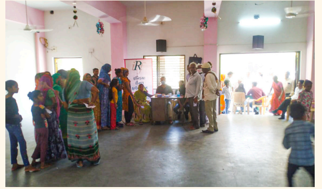
મેહી ગામ, તા.જી. મહેસાણા