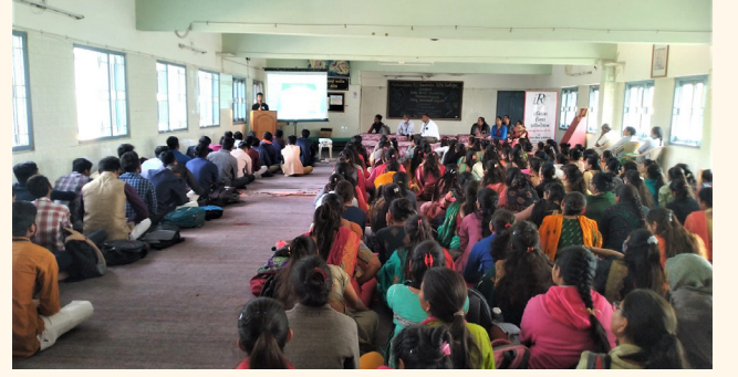
માતૃશ્રી બી.એડ કોલેજ, પાલનપુર