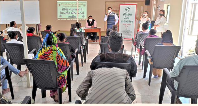
ઇન્ડિયન રેડ ક્રોસ સોસાયટી, ભાવનગર