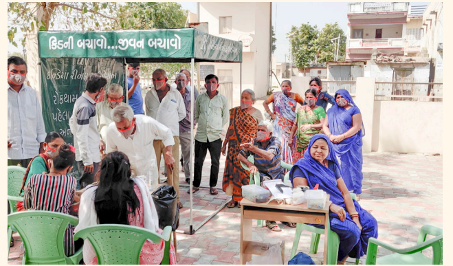
રામનગર ગામ, તા. દેહગામ, જી. ગાંધીનગર